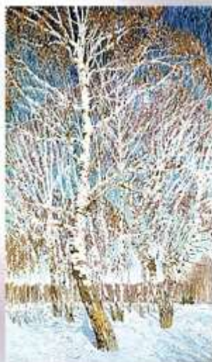
И. Э. Грабарь "Февральская лазурь"

Музыка – П.И. Чайковский - «Масленица. Февраль»