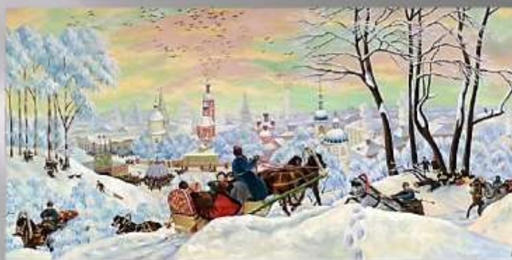
Б. Кустодиев «Масленица»

Скоро масленицы бойкой Закипит широкий пир. П.А. Вяземский