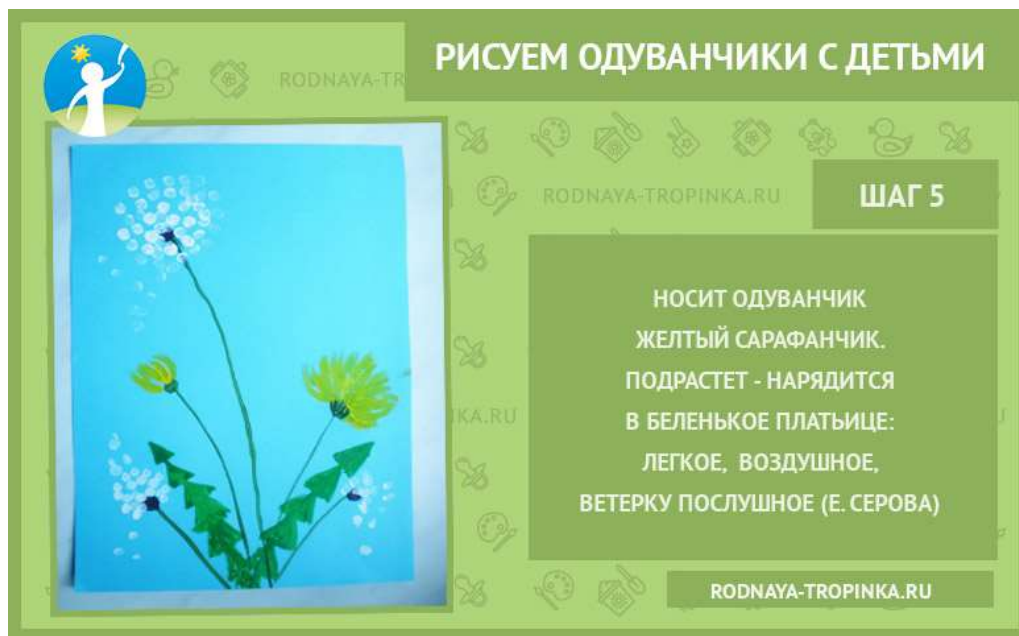
Рисунок готов! Хорошего всем лета! Несмотря на то что во многих регионах оно в этом году холодное, дождливое, нас могут порадовать рисунки с такими солнечными цветами! Удачи вам в творчестве и хорошего летнего отдыха!

Слегка обмакнуть противоположную сторону палочки в желтую краску и легким нажимом на неё нарисовать желтые лепестки одуванчика. Движение палочки идет от сердцевинки с нажимом и постепенным отрывом.