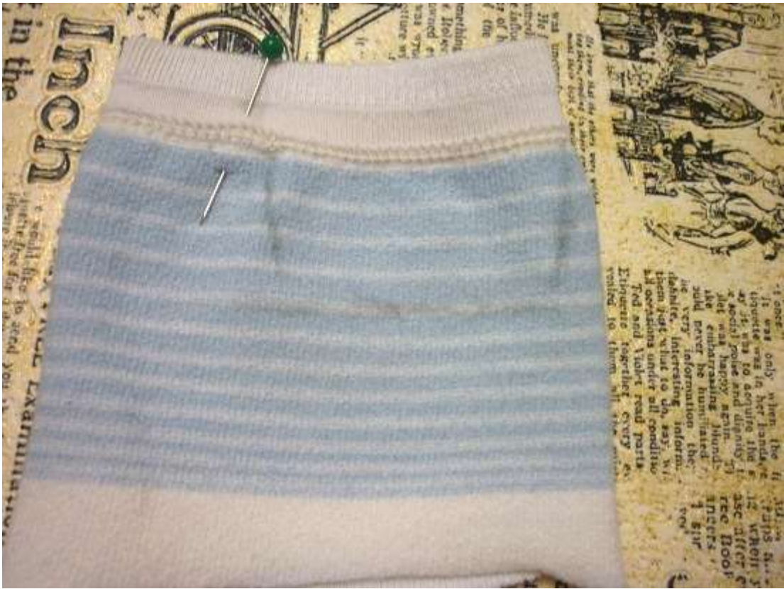
8. Скальваем портновскими булавками, вырезаем немного отступая.